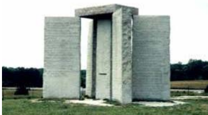
Die Guidestones von Georgia

„Wenn die Welt nur aus Lügen besteht, wird die Wahrheit das Einzige sein, was niemand mehr glaubt“. (unbekannter Verfasser) Lassen wir es gar nicht so weit kommen.