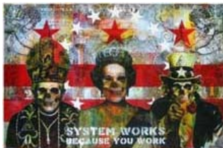
Hommage an David Icke

Du bist als original geboren, stirb nicht als Kopie.