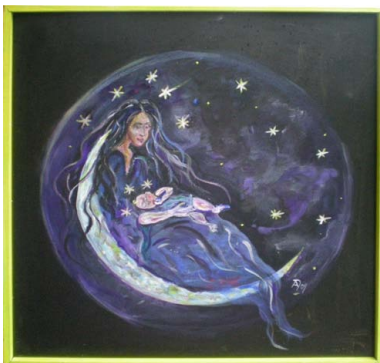
© Andrea Dechant - noch mehr Bilder www.artedea.net

Wir möchten gerne die vielfältigen Hintergründe erzählen, das was wirklich geschieht auf unserem Planeten, -